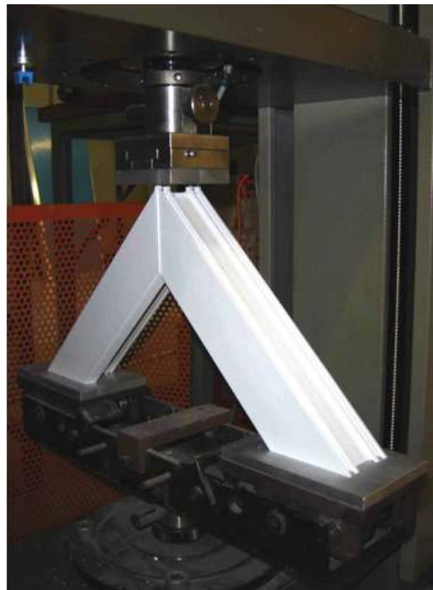
Control de calidad de los perfiles Veka

Una ventana o puerta falla habitualmente por la acción de esfuerzos de corte lateral –perpendicular al plano de la ventana– inducidos por la acción del viento y asentamientos diferenciales de las estructuras, provocando fuerzas de empuje hacia los costados de la ventana y elevadas concentraciones de tensiones en las esquinas. Por ello, lo más importante es prestar atención a la forma en la que se unen los perfiles en las esquinas de la ventana.